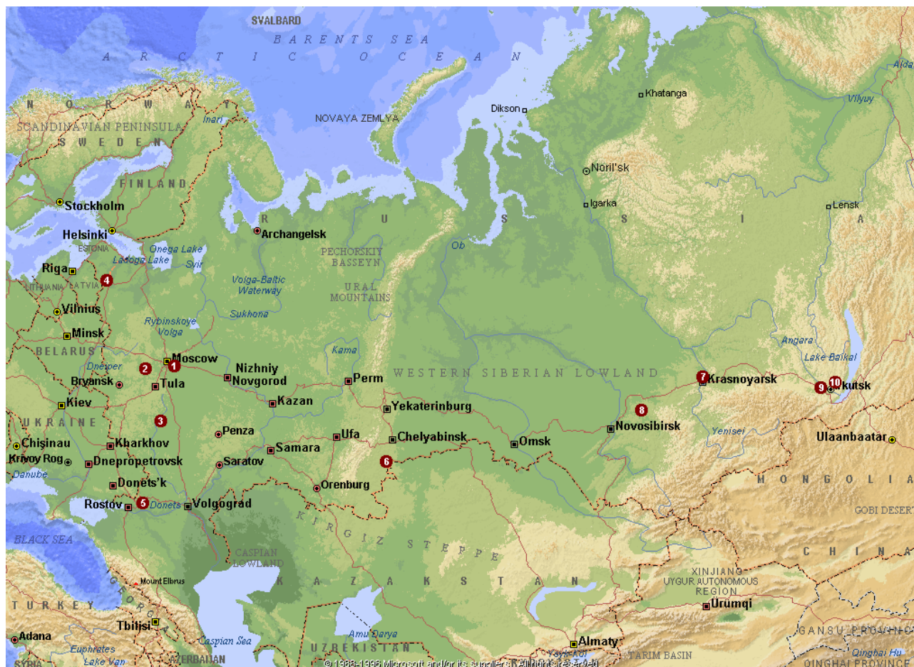
Рисунок 2. Расположение месторождений керамического сырья в России

1 – XXXXXXXXXXXXXXXX, 2 – XXXXXXXXXXXXXXXX, 3 – XXXXXXXXXXXXXXXX, 4 – XXXXXXXXXXXX, 5 – XXXXXXXXXXXXXXXX, 6 – XXXXXXXX, 7 – XXXXXXXXXXXX, 8 – XXXXXXXXXXXXXXXX, 9 – XXXXXXXXXXXXXXXX